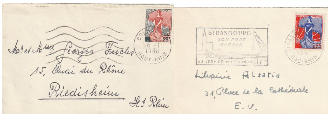
Tarif 1 er échelon en Franc et NF

Les tarifs postaux du 6 janvier 1959 sont inchangés. Faire la conversion Franc/NF